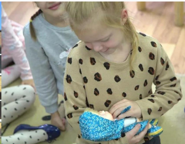
Жила-была в детском саду кукла Маша, она всем нравилась. Ребята очень любили с ней играть.